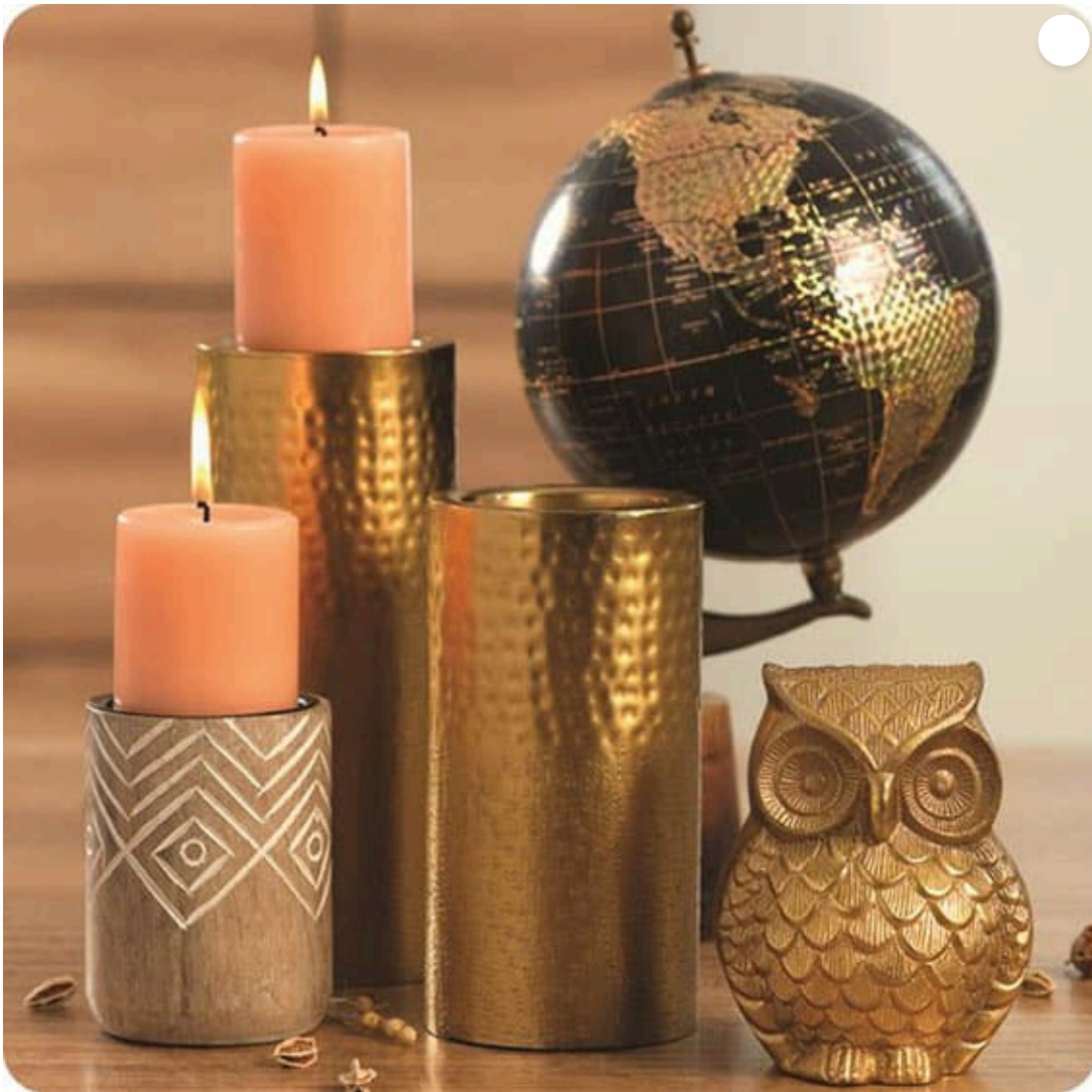
Die nächste, 59., IHGF Delhi Messe im Frühjahr ist für den 16. bis 19. April 2025 angesetzt